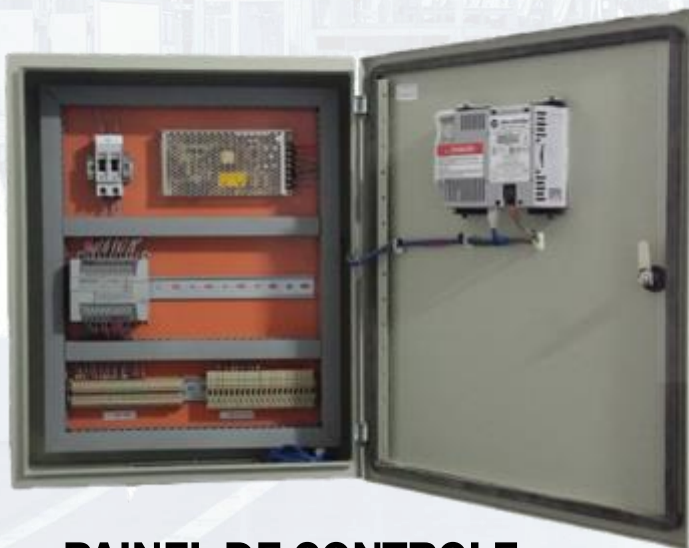
PAINEL DE CONTROLE