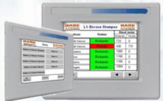
INTERFACE DE OPERAÇÃO